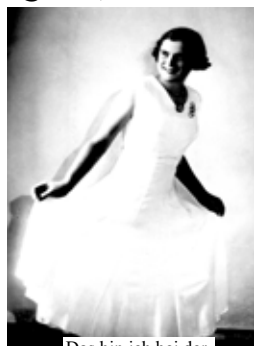
Das bin ich bei der Olympiade 1936

Wir haben gemeinsam ein rauschendes Fest gefeiert, zu dem auch der Ehrenausschuss mit einem eindrucksvollen Film über den TSV beitrug.