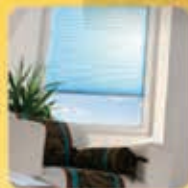
Plissee und Rollos