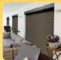
Elektr. Umrüstung von Rollläden